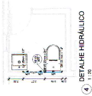
4 DETALHE HIDRÁULICO 1:20